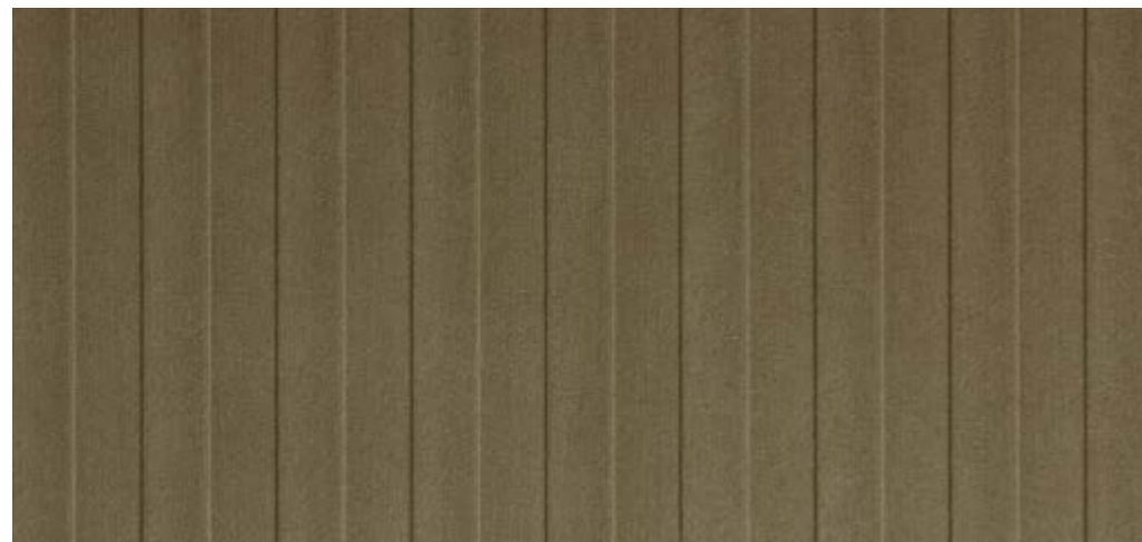
FL LANE VELVET Mocha 2600 x 1000 x 1,3 | NA 29278 | SA 29310