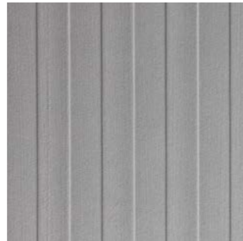
FL LANE VELVET Pearl 2600 x 1000 x 1,3 | NA 29279 | SA 29311