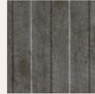
LL LANE METALLIC USED Steel 2600 x 1000 x 1,4 | NA 29275 | SA 29307