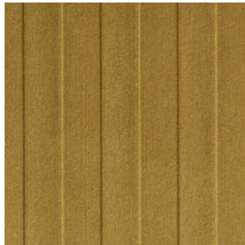
FL LANE VELVET Curry 2600 x 1000 x 1,3 | NA 29277 | SA 29309

Das Zusammenspiel der haptischen Beschaffenheiten, Strukturen und Farben schaffen ein einzigartiges multisensorisches Erlebnis.