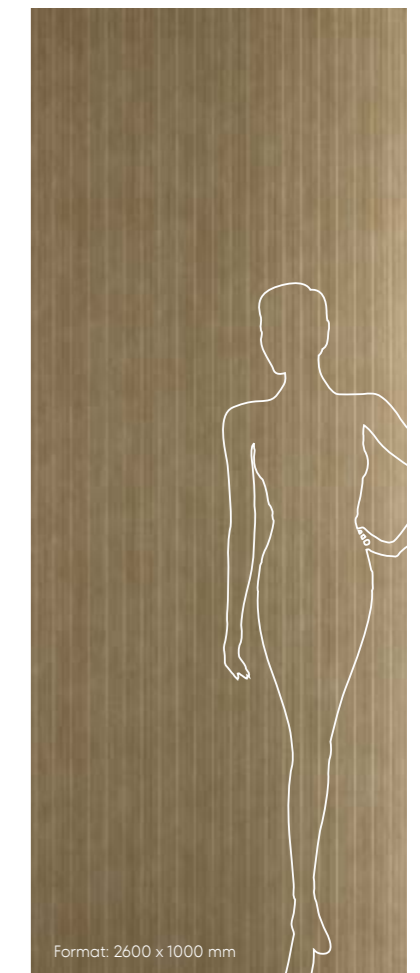
Format: 2600 x 1000 mm

LANE METALLIC USED Sanfte Bürstung, strichmatte Metalltöne bietet eine interessante Optik mit angenehmer Haptik – ohne sich in den Vordergrund zu drängen.