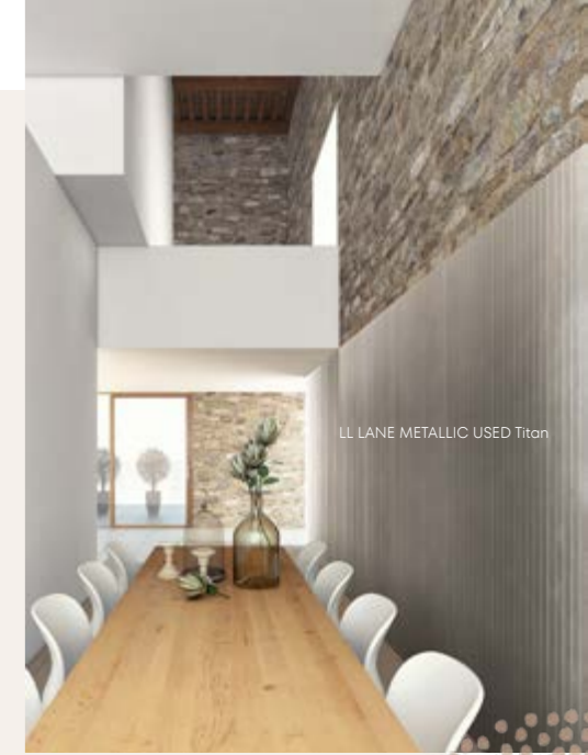
LL LANE METALLIC USED Titan

LANE METALLIC USED Sanfte Bürstung, strichmatte Metalltöne bietet eine interessante Optik mit angenehmer Haptik – ohne sich in den Vordergrund zu drängen.