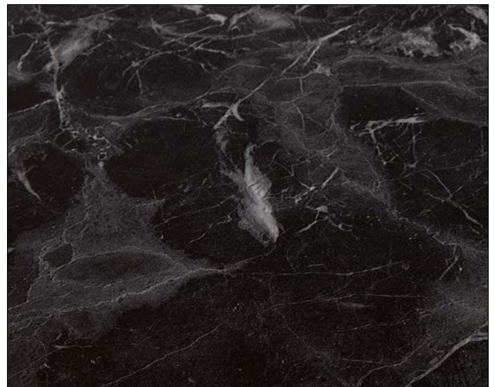
OL MARBLE Black matt AR