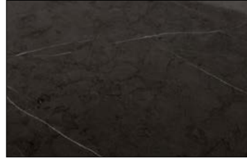
OL MARBLE Grey matt AR 2600 x 1000 / NA 22629 / SA 22637