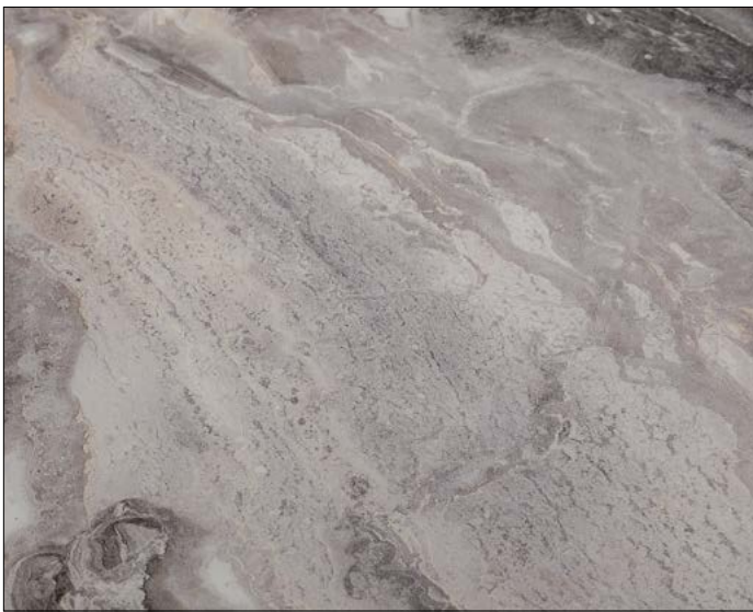
OL MARBLE Alpine matt AR

Silky matt design surfaces, combined with excellent abrasion resistance, make the OPACO-LINE essential for interiors with high design standards. The OPACO-LINE impresses with longevity thanks to extremely abrasion-resistant surfaces, noble and matt stone decors and silky matt soft-touch effect.