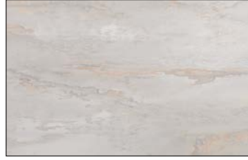
OL GENESIS White matt AR 2600 x 1000 / NA 22626 / SA 22634