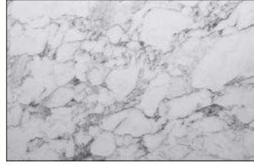
OL MARBLE White matt AR 2600 x 1000 / NA 22625 / SA 22633