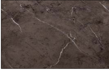
OL MARBLE Brown matt AR 2600 x 1000 / NA 22628 / SA 22636