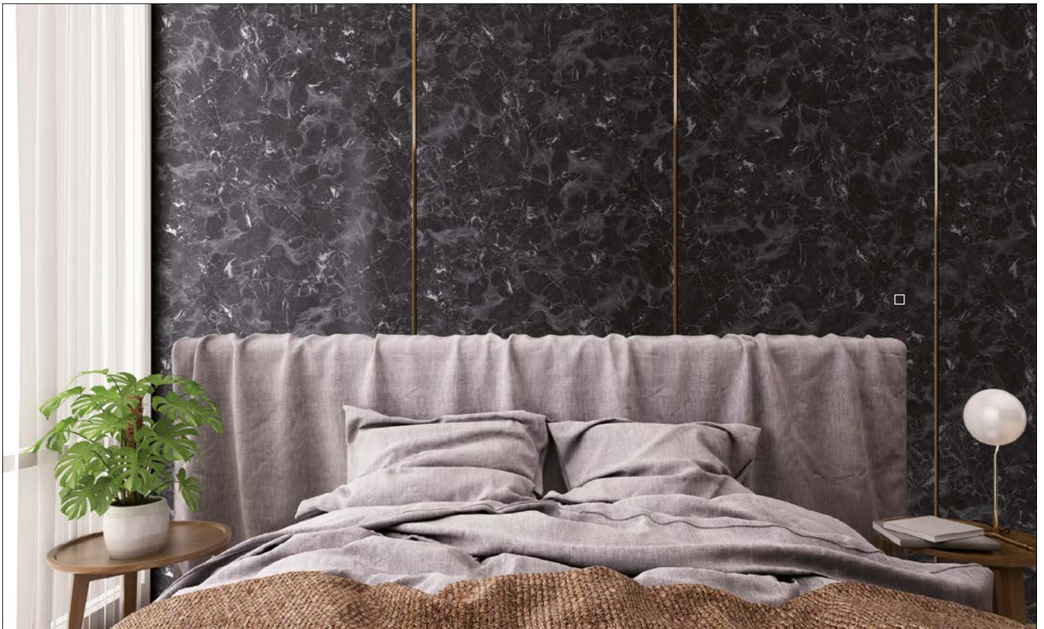
□ OL MARBLE Black matt AR