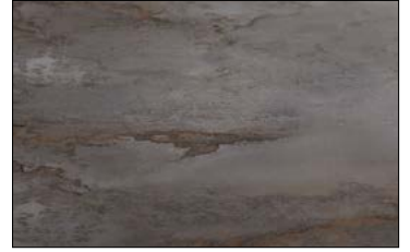
OL GENESIS Grey matt AR 2600 x 1000 / NA 22631 / SA 22639