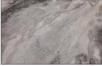
OL MARBLE Alpine matt AR 2600 x 1000 / NA 22624 / SA 22632