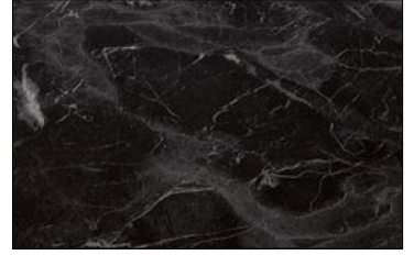
OL MARBLE Black matt AR 2600 x 1000 / NA 22627 / SA 22635