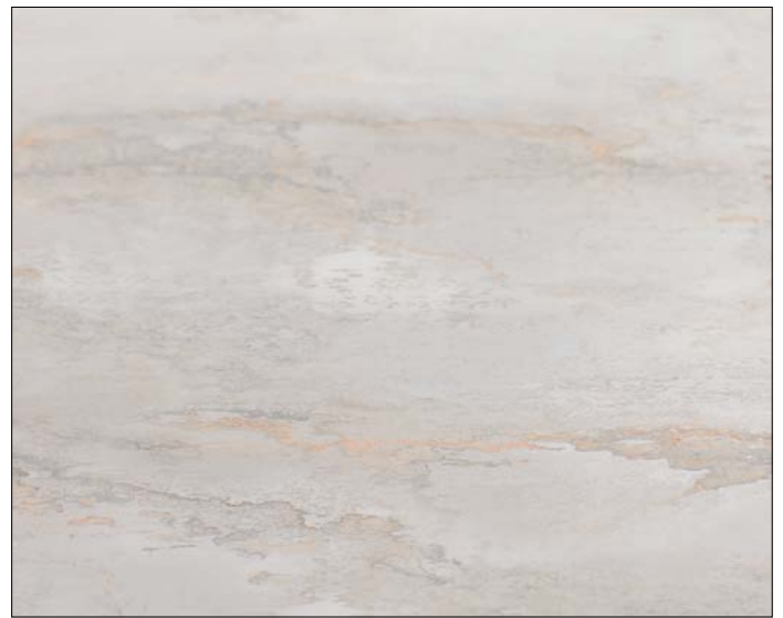
OL GENESIS White matt AR